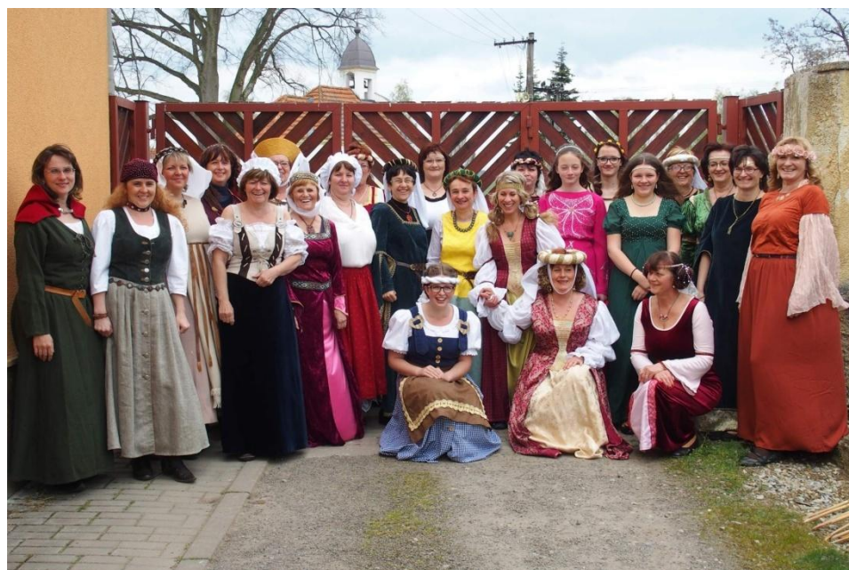
Ženy a dívky ve středověkých kostýmech.