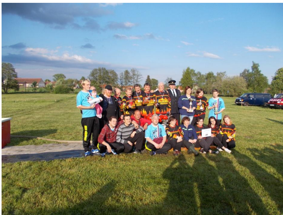
Soutěžní týmy hasičů, hasiček a veteránů Křenovice