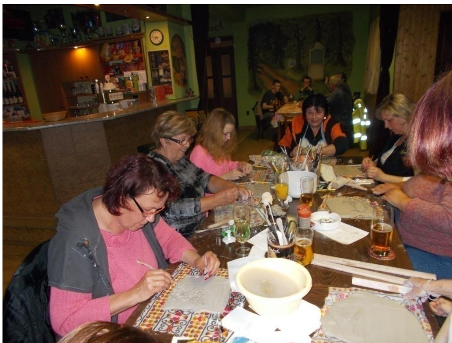
Výtvarné podzimní odpoledne – ženy vyráběly hliněné cedulky s č.p. na vrata

Sluníčko během roku pořádalo akce především pro děti. Nechybělo výtvarné odpoledne nebo den dětí – v podobě míčových her na hřišti. S akcemi pomáhala i paní hostinská, která zajišťovala občerstvení a pomáhala s organizací akcí, které se konaly u obecní hospody nebo přímo v jejích prostorách.