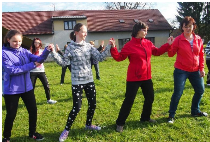
Několikatýdenní přípravy žen a děvčat.

Odpolednem na návsi provázela kapela Evergreen Band, která hrála k tanci i poslechu. V podvečer se oslavy přesunuly do obecní hospody, kde zahráli Hastrmani.