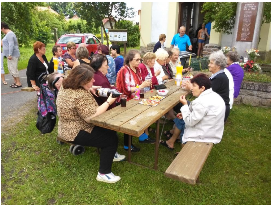
Po skončení mše bylo připraveno malé pohoštění.