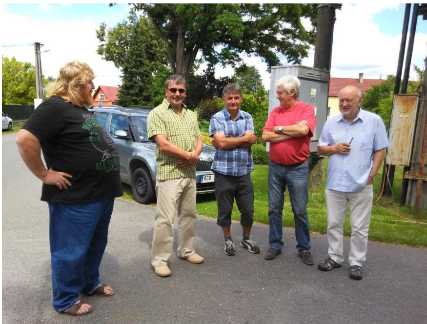
Shromáždění u kapličky.

V podvečer pokračovaly oslavy pod přístřeškem obecní hospody, kde k tanci a poslechu hrála kapela J. Franců.