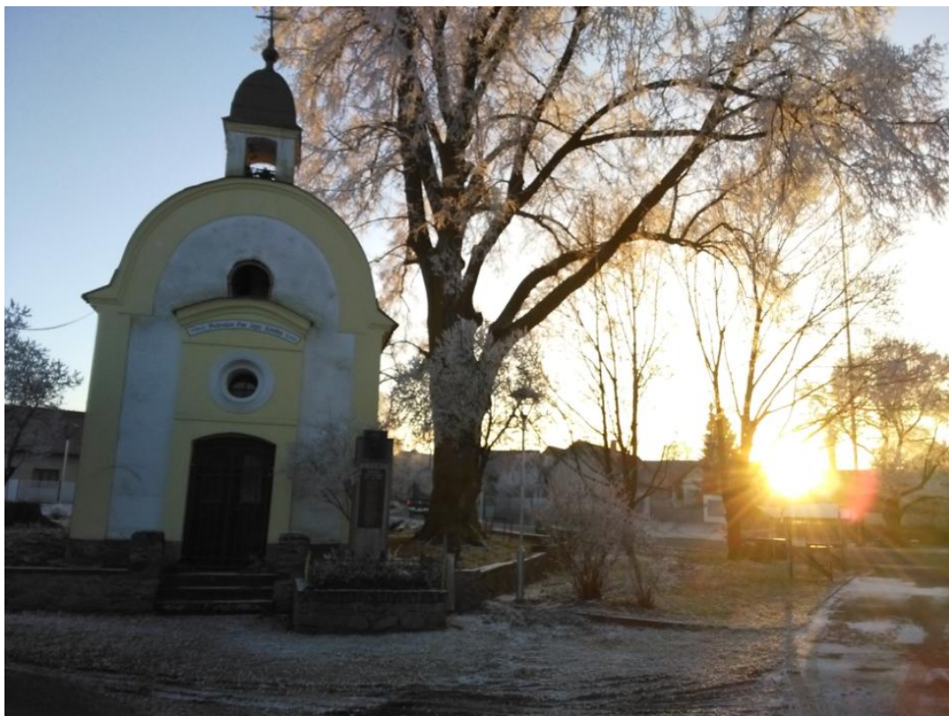
Pohled na kapličku na návsi v silvestrovském podvečeru.