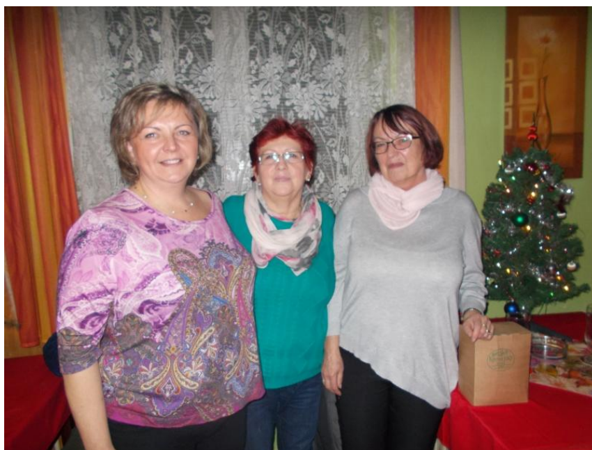
Paní Góčová při předání ceny.