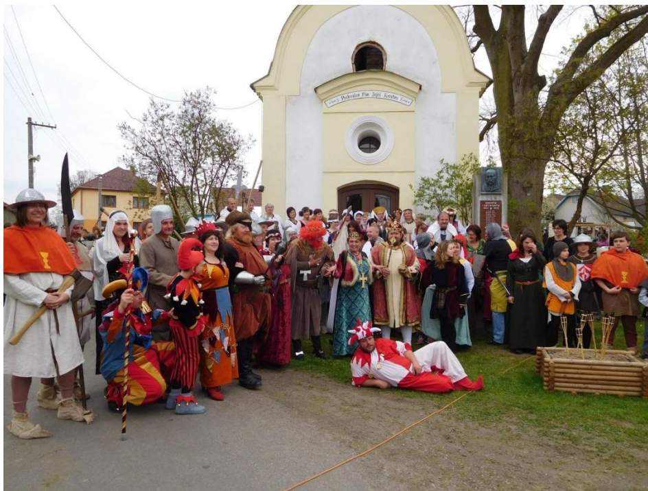
Seskupení všech aktérů prvomájových oslav.