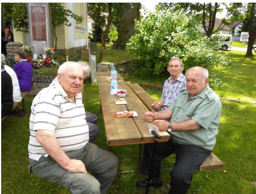
Posezení u kapličky.