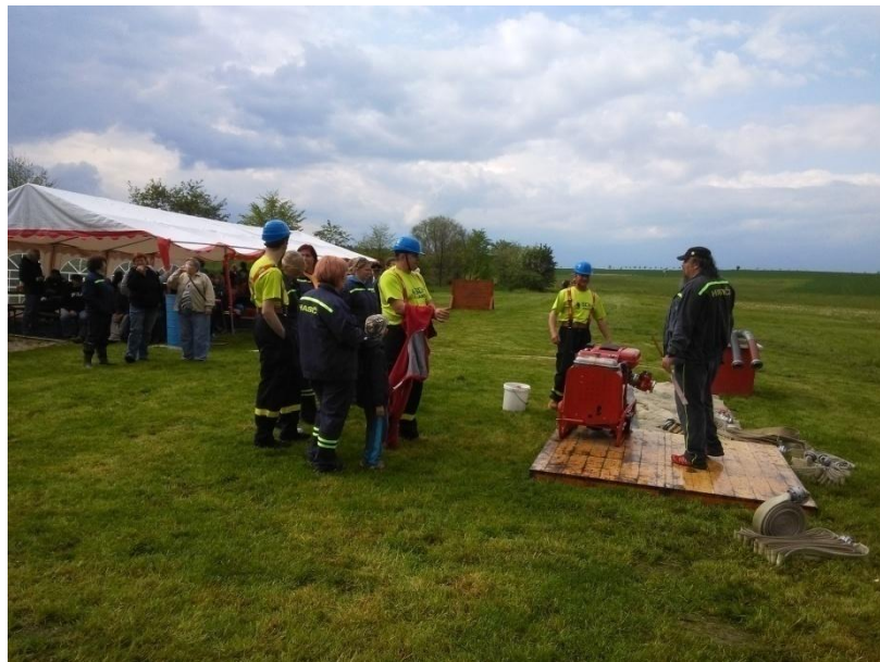
Soutěžní mužstvo připravující se k útoku.

14. 5. 2016 se konala v Křenovicích na louce hasičská okrsková soutěž. Soutěžilo se v požárním útoku a soutěži jednotlivců - štafetě. Křenovice měly ženské a mužské družstvo. Počasí bylo jako na houpačce, chvíli pršelo a chvílemi svítilo sluníčko. Křenovické hasičky ve své kategorii zvítězily a vychutnávaly si domácí vítězství. Muži skončili na 3. místě.