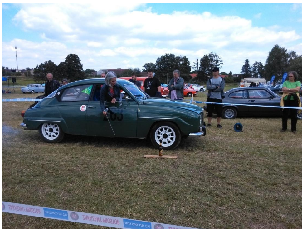
Zábava při plnění zajímavých úkolů.