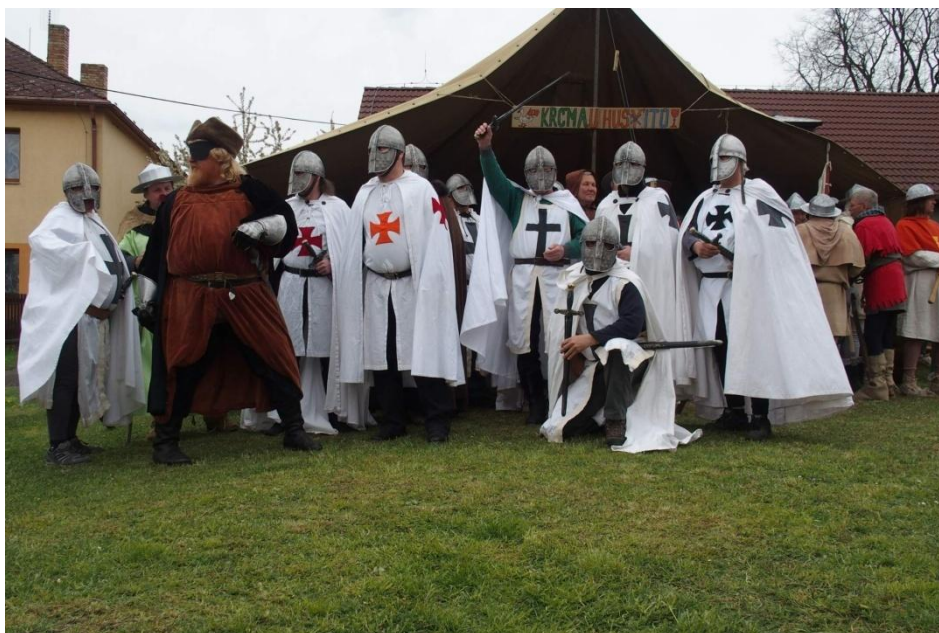
Křižácká výprava. Aktéři přijeli až z Milevska.