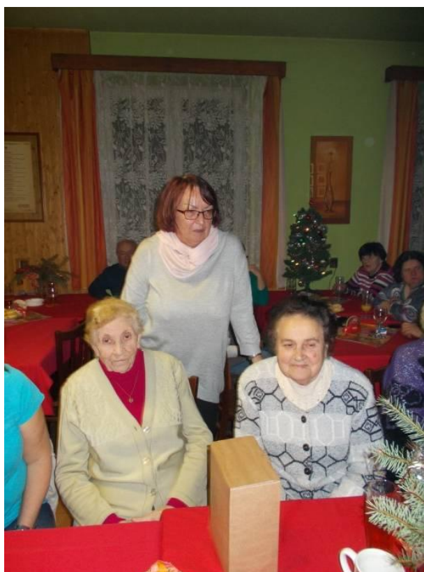
Paní Bendová při předání ceny.