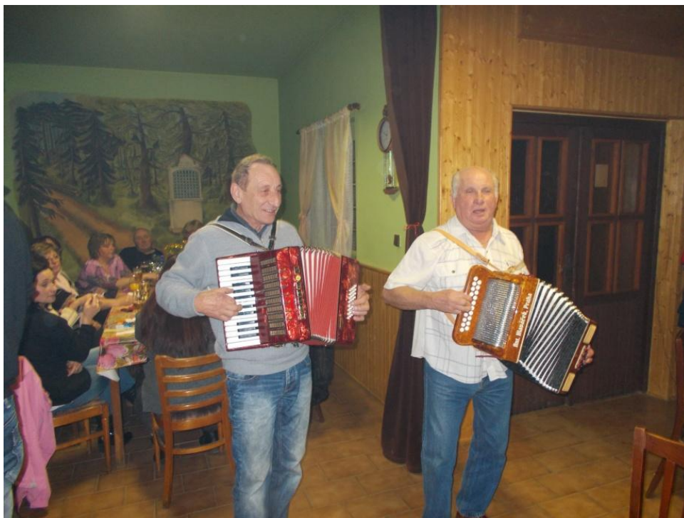
Harmonikáři přijeli z nedalekého Podolí.