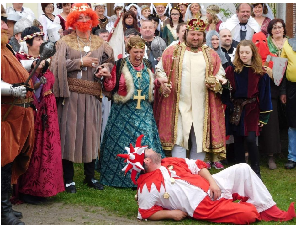
Královská rodina i s dvorním šaškem.