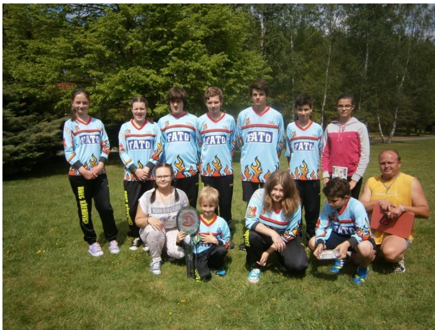
Jarní kolo soutěže Plamenu 2016 a družstvo mladých hasičů.