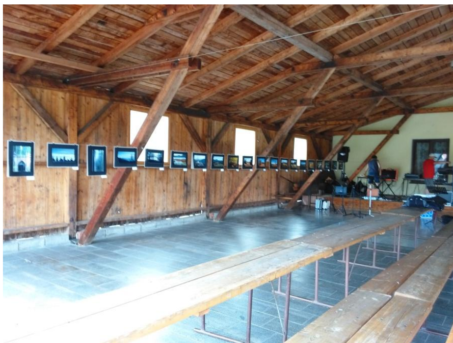
Výstava fotografií pod přístřeškem obecní hospody.