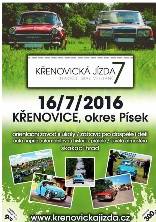
Plakát křenovické jízdy.

16. 7. 2016 se od brzkého rána začala zaplňovat Slavíkova louka historickými automobily a motocykly. Někteří účastníci přijeli už v pátek večer. Křenovická jízda se těší velké oblibě. Sedmý ročník se vydařil, důkazem toho byl vysoký počet návštěvníků.