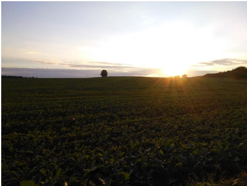
Cesta ke Struhám

21.9.2016 byl krásný den jako stvořený pro procházku (foto).