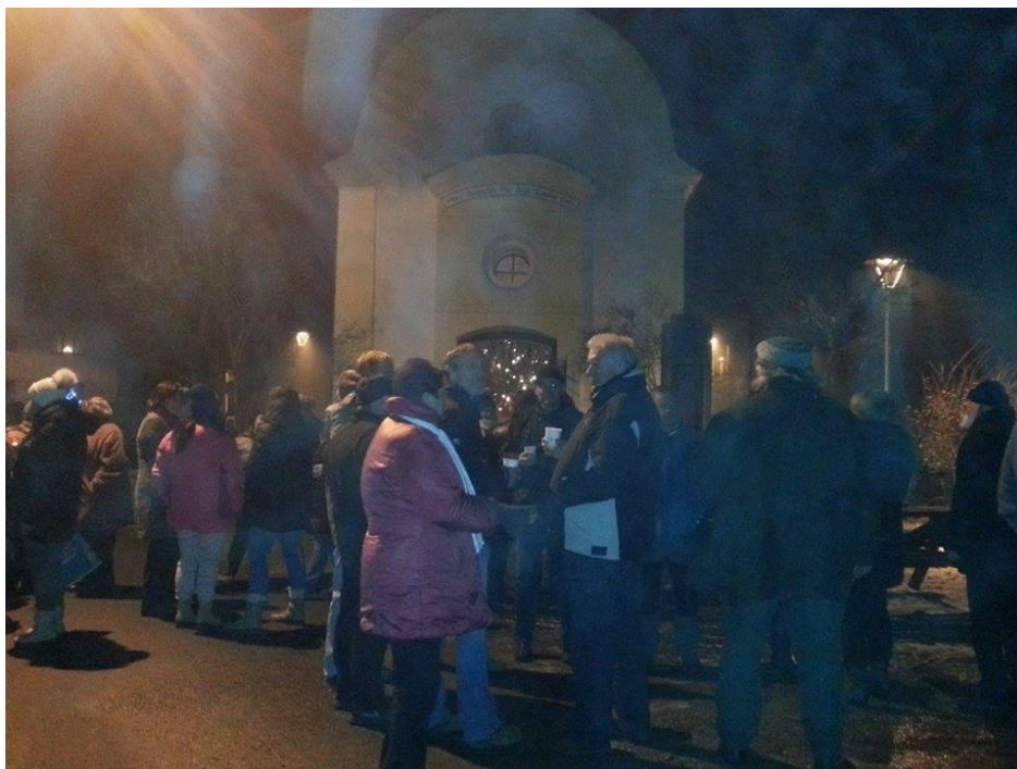
Vánoční setkání místních občanů.