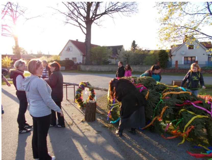
Křenovické ženy zdobící májku na návsi.

Jako tradičně, i tento rok se posledního dubna konalo pálení čarodějnic. Místní občané se odpoledne sešli ke zdobení májky. V podvečer se zapálila hranice s čarodějnicí. Místní si poté opékali buřty a pod přístřeškem obecní hospody se grilovala kuřata, která si mohli občané dopředu objednat. Po setmění se konal tradiční lampionový průvod.