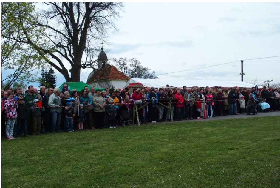
Na křenovické návsi se sešlo okolo tří set návštěvníků.