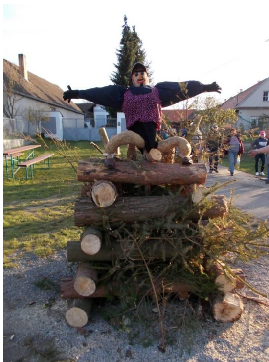
Čarodějnice na hranici